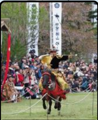
甲斐の勝山やぶさめ祭り

道の駅から富士御室浅間神社までは湖畔遊歩道をゆっくり歩いて20分程度。季節の草花は、四季折々新鮮な表情を見せてくれます。またゆかりのある「田中冬二詩碑」「谷崎潤一郎文学碑」も見どころです。レイクスポーツや釣りのメッカとしても人気のエリア勝山をマンホールカード片手にお楽しみください。