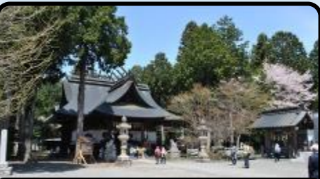
富士御室浅間神社