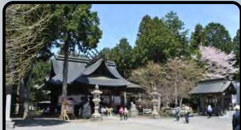
富士御室浅間神社