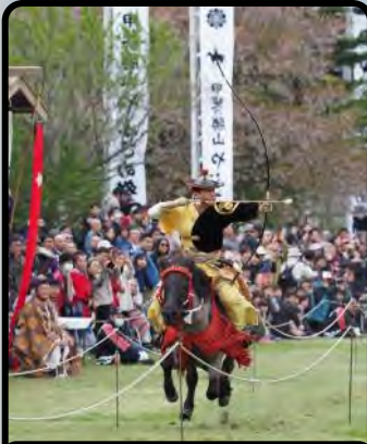
甲斐の勝山やぶさめ祭り