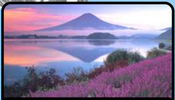
富士山とラベンダー畑