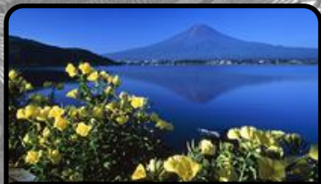
富士山とツキミノウ