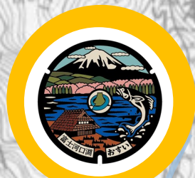
西湖いやしの里根場

デザインマンホールが設置されている西湖根場地区は、湖越しの富士山を眺められる絶景スポットです。周辺には茅葺住居が立ち並ぶ野外博物館や、富士北麓の溶岩洞穴では最大規模の西湖コウモリ穴、生きたクニマスや西湖に生息する魚を観察することのできるクニマス展示館があります。また、西湖ネイチャーセンターは、ネイチャーガイドツアーの拠点となっており、ガイドの解説を聞きながら、富士の樹海を散策することができます。