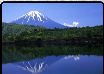
根場から見た富士山