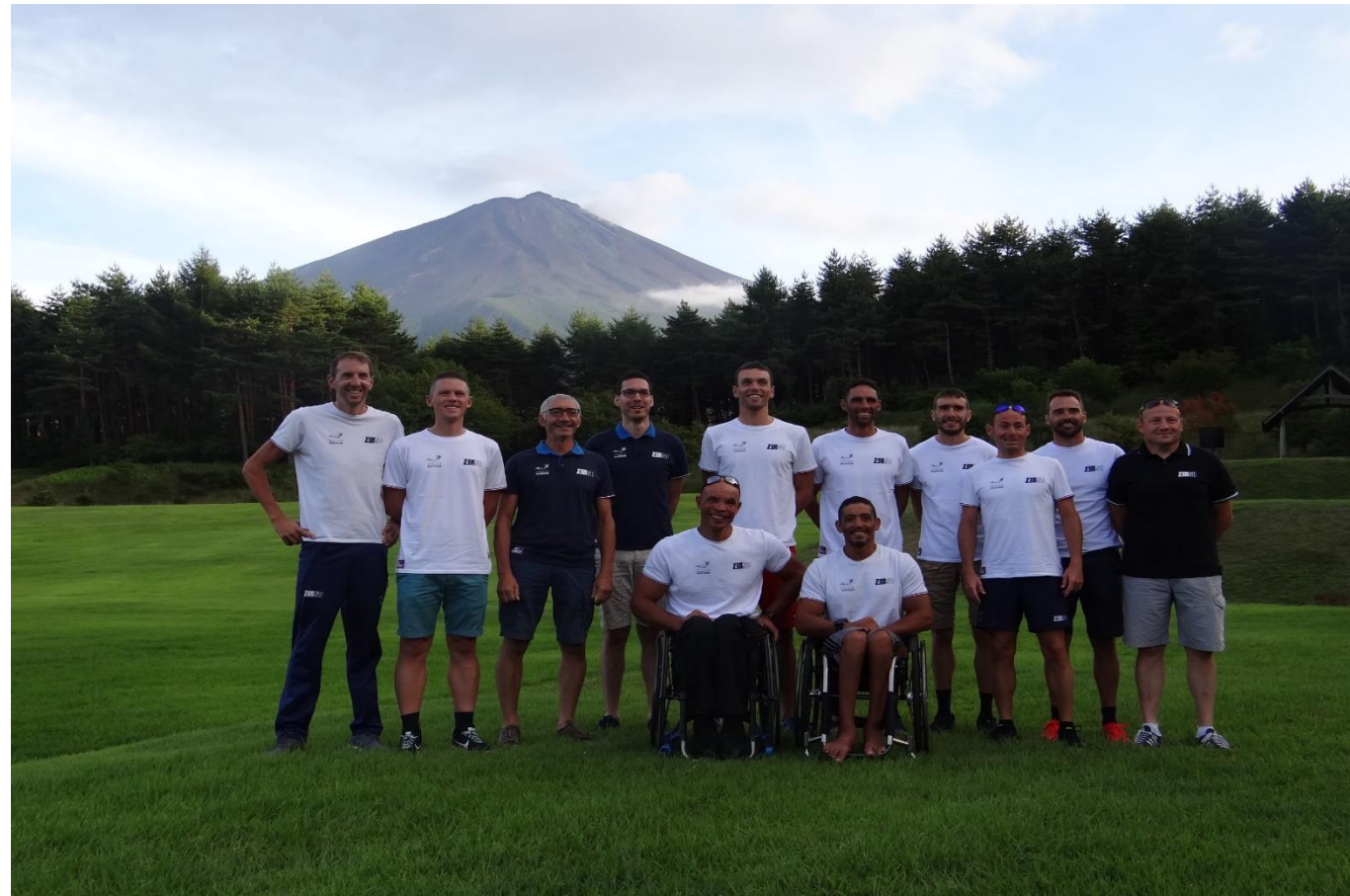
ITUパラトライアスロンワールドカップ東京大会事前合宿受入(8/11~15) フランスパラトライアスロンチーム