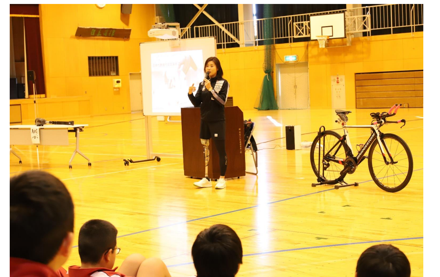
パラスポーツメッセンジャー(11/18) パラリンピアンによる中学生を対象にした講演会