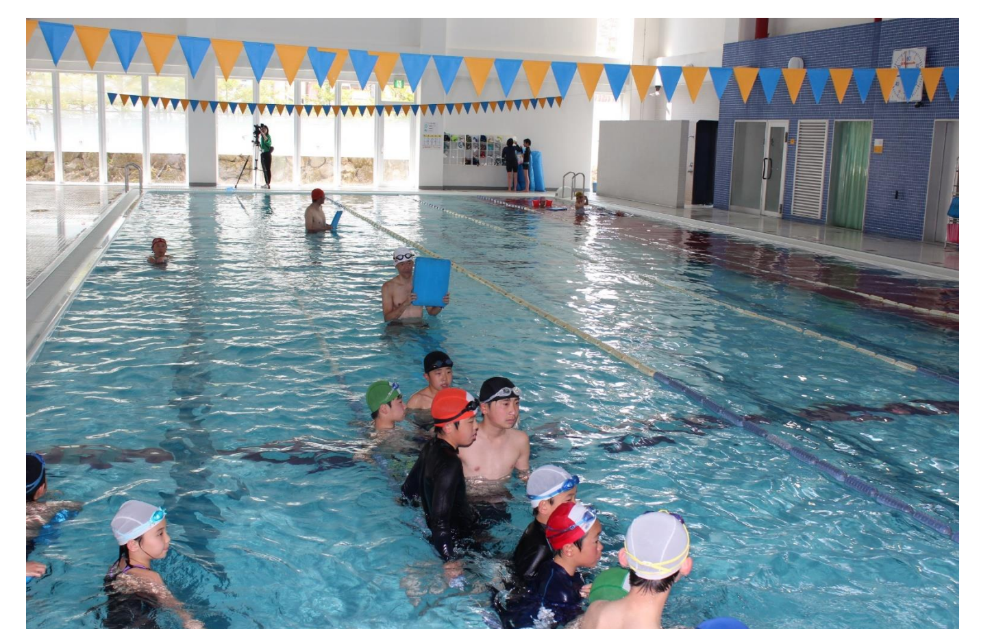
トライアスロン教室(4/20) プロデュース選手による指導