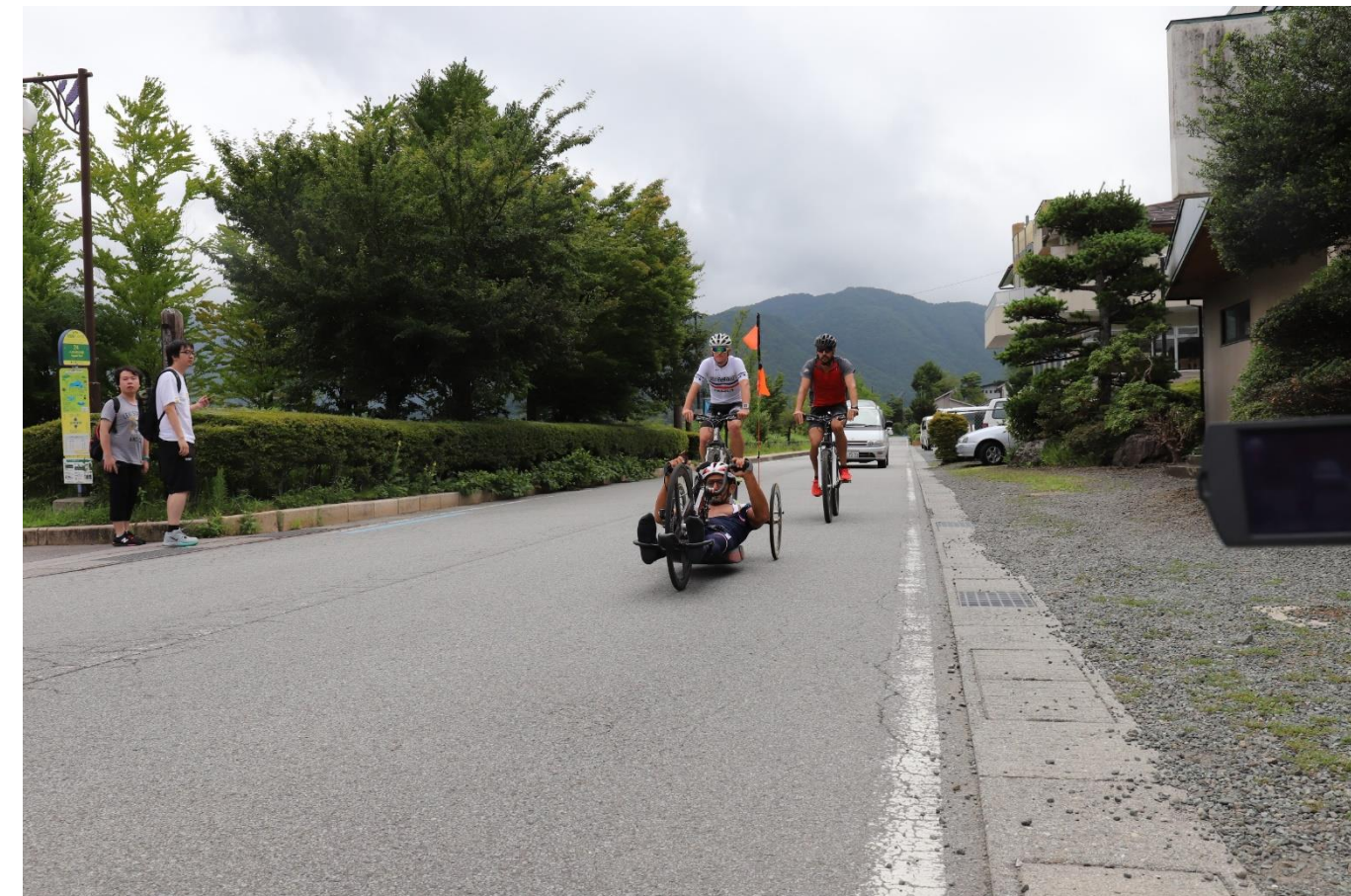
ITUパラトライアスロンワールドカップ東京大会事前合宿受入(8/11~15) 河口湖周遊道路でのバイク練習