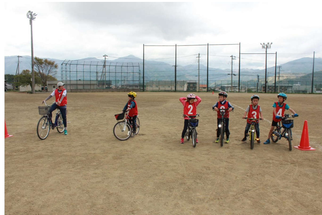
プチトライアスロン大会(5/6) 誰でも参加できるトライアスロン大会の開催