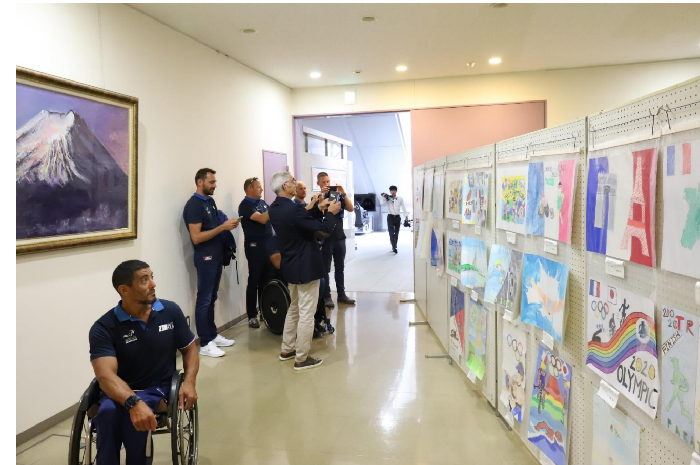
ITUパラトライアスロンワールドカップ東京大会事前合宿受入(8/11~15) 子どもたちの絵画展示