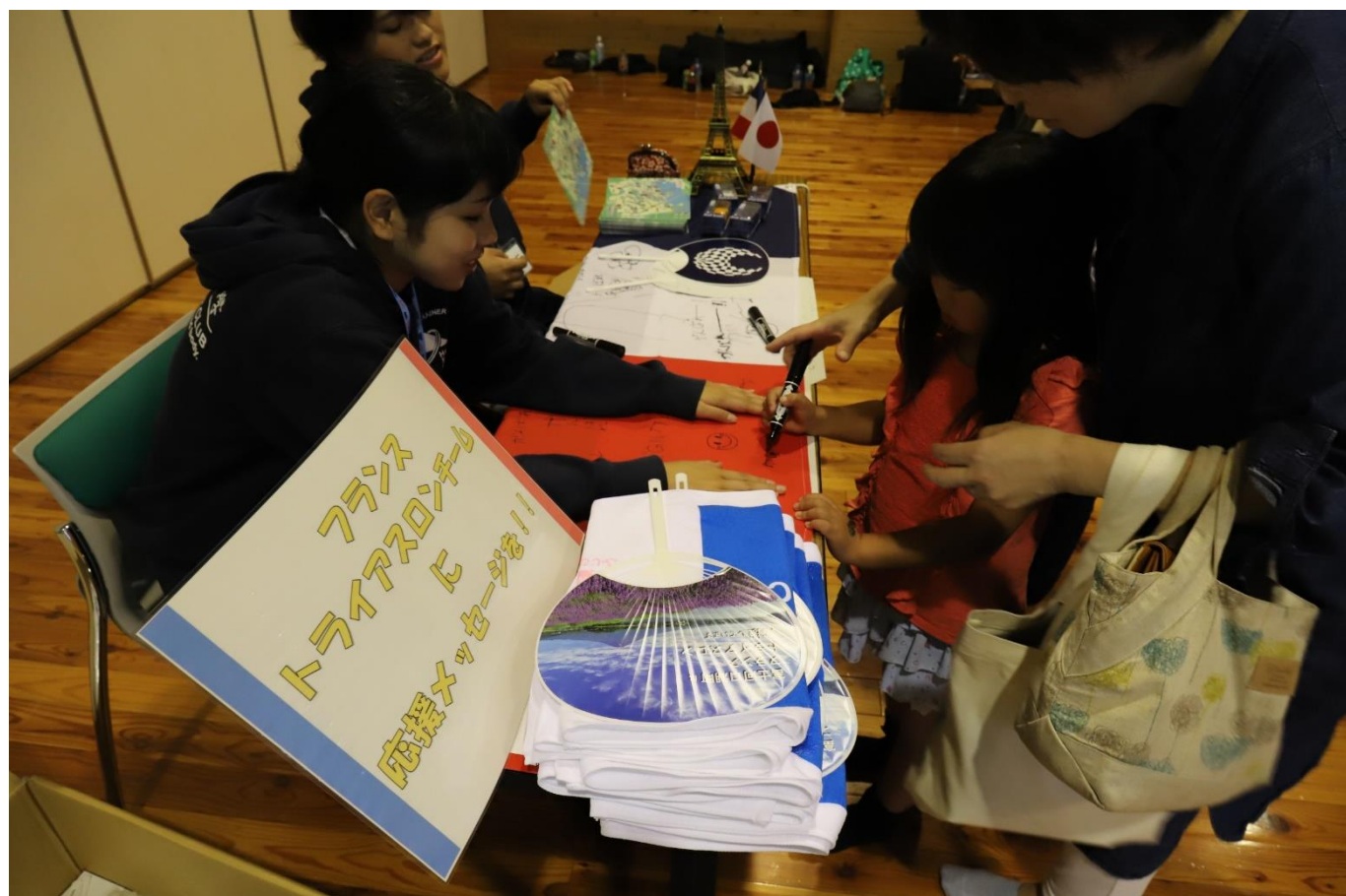
富士河口湖 まちフェス(10/6) フランス国旗ヘトライアスロンチームに応援メッセージを