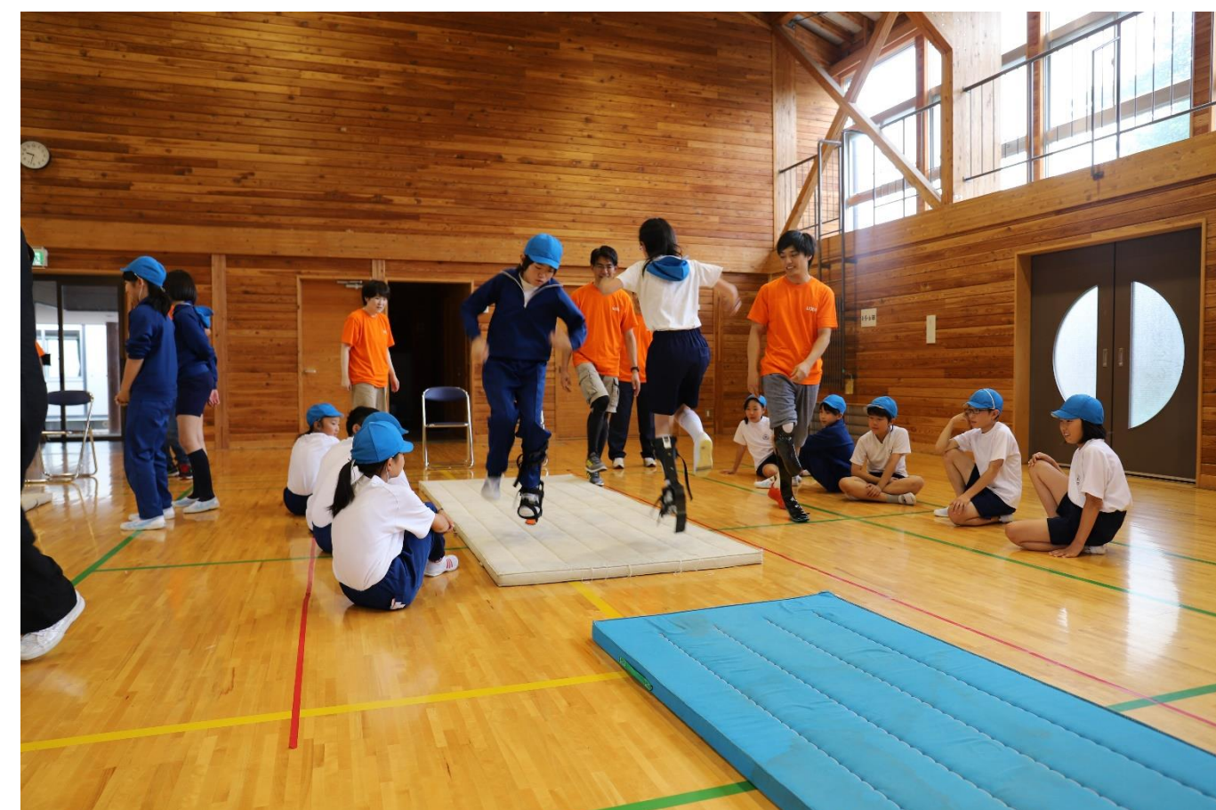
スポーツ義足体験授業(7/19) パラアスリートによる体験授業