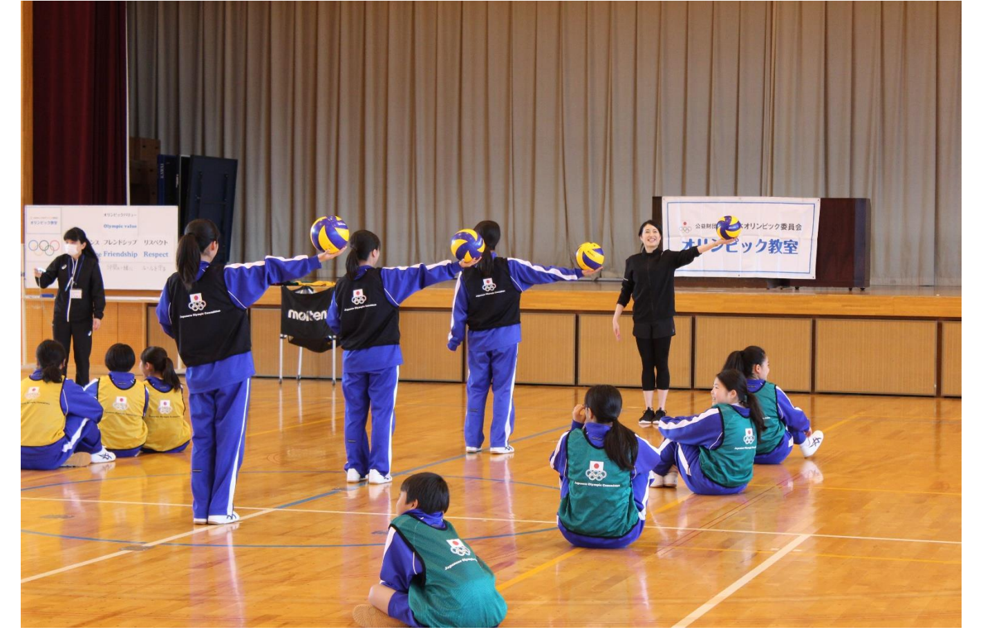
オリンピック教室(5/9) オリンピアンによる指導