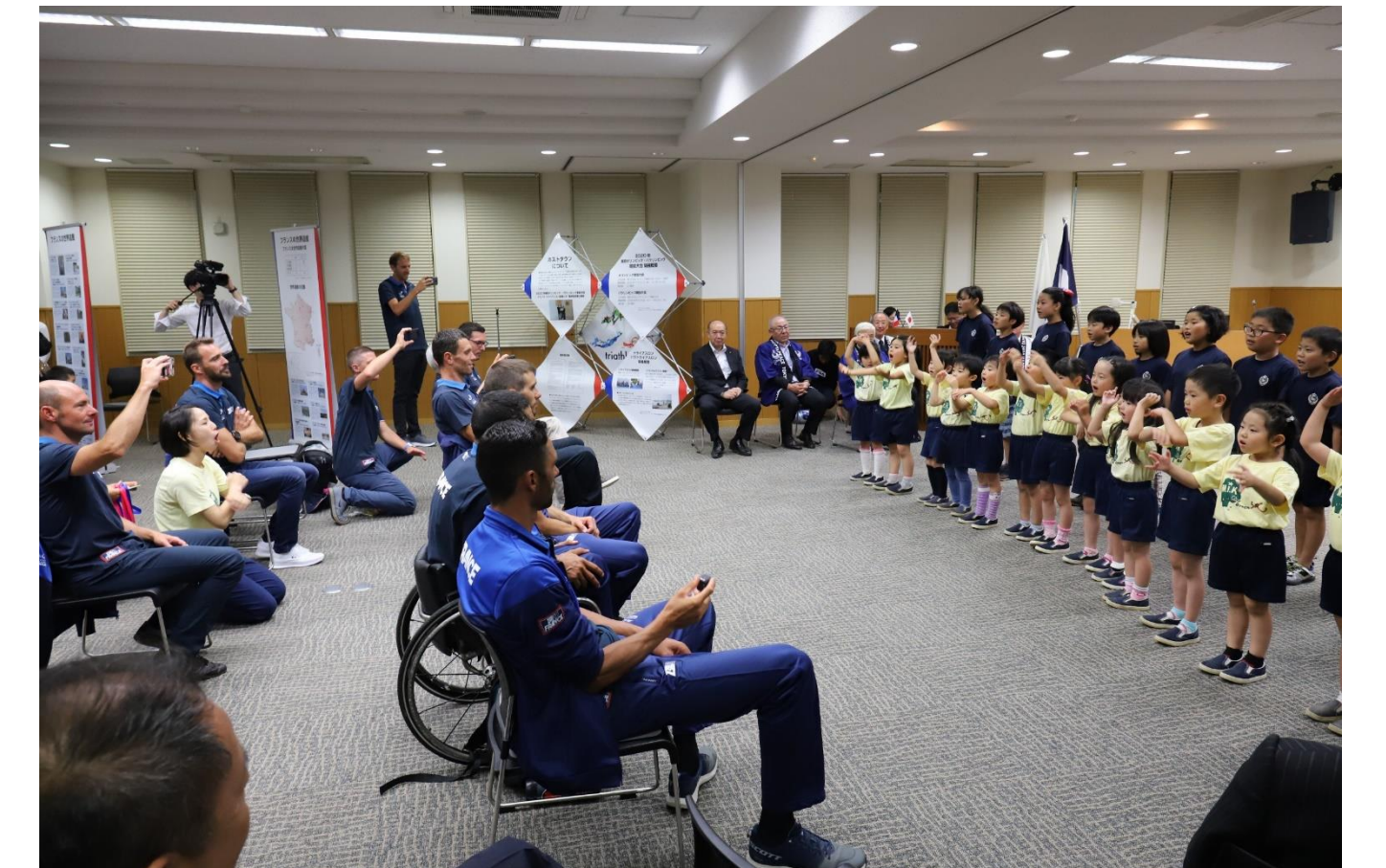
ITUパラトライアスロンワールドカップ東京大会事前合宿受入(8/11~15) 歓迎セレモニー