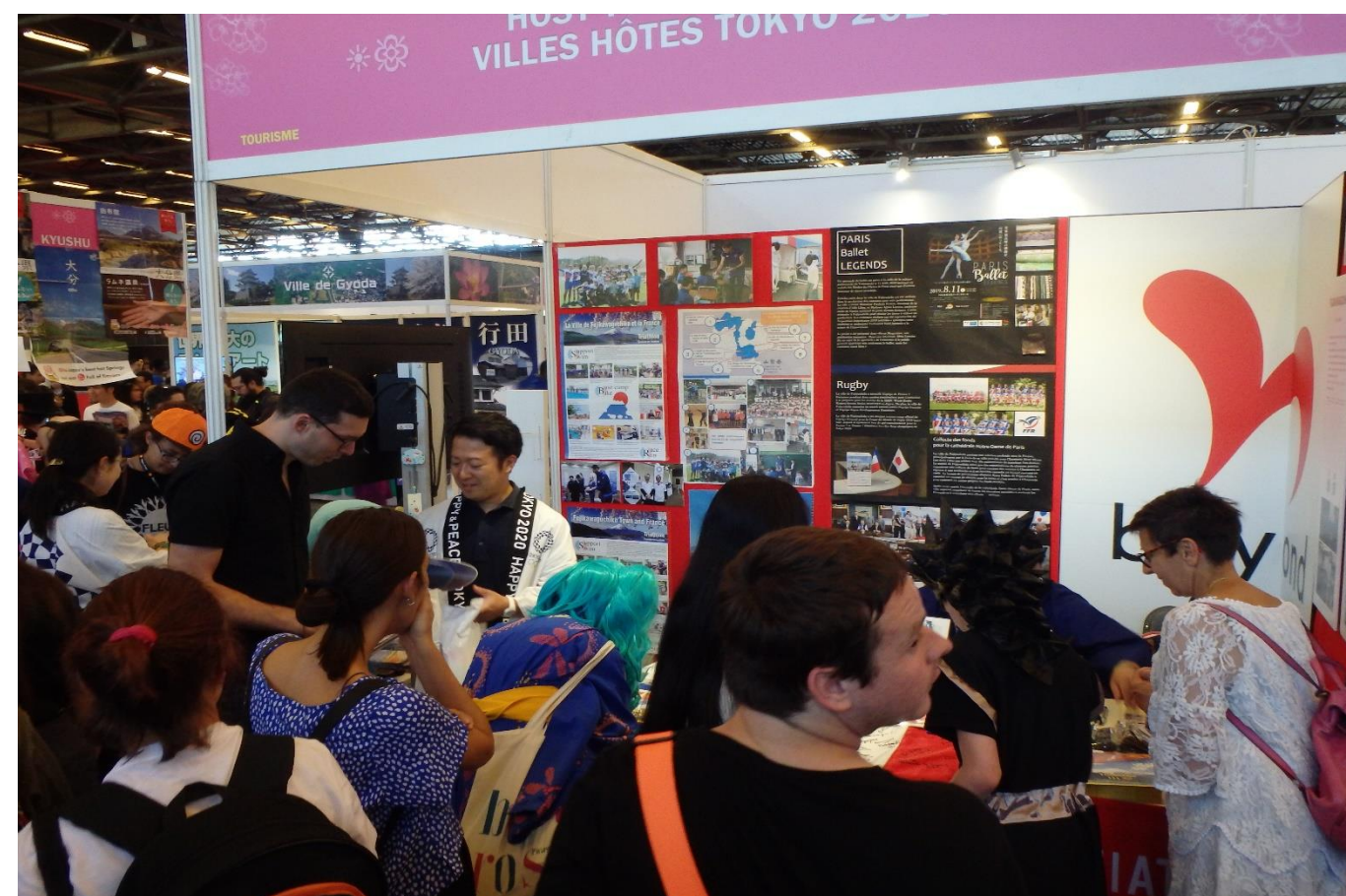
ジャパンエキスポ(7/4~7) パリで開催され、ホストタウン事業の紹介ブースを出展