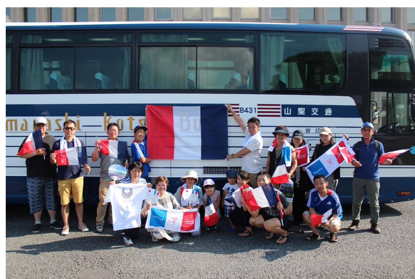
ITUパラトライアスロンワールドカップ東京大会(8/17) 町民向け応援バスツアー