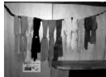
大石紬伝統工芸館では色が選べます