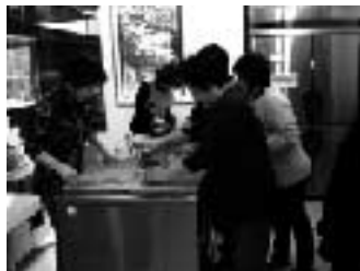
どんな出来栄えか楽しみです