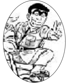
秋本 治 作 / 集英社刊

そんな堀内さんを招いての講演会を開催します!あの破天荒な両さんのキャラクターはどうやって生まれたの?作者の秋元治さんはどんな人?などなど知られざる「こち亀」の秘密が分かっちゃうかもしれない!?'こち亀'好きなら誰でも楽しめる講演会です。ぜひ足を運んでみてください!!