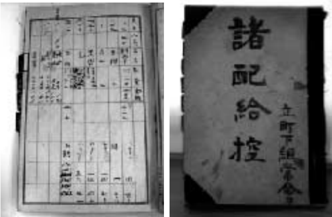
昭和18年～22年当時の資料

もちろんほとんど当たらない「くじ」引き。 こちらの記録から戦争末期から終戦直後の 生活を想像してみよう。