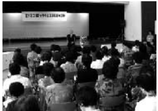
第一回として女連協の皆様を受講していただきました。申し込みは生涯学習課へ