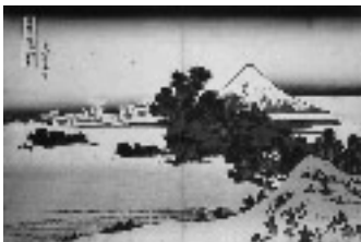
葛飾北斎(1760 - 1849) 「富嶽三十六景 相州七里浜」 (紙に木版・江戸時代)