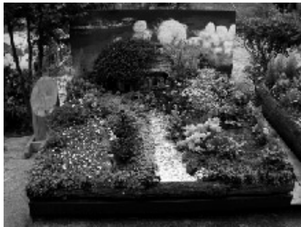
金賞 受賞 作品

2008河口湖ハーブフェスティバル「ガーデニングコンテスト」に出展された作品のうち、上位入賞作品を展示しています。ぜひ、ご覧下さい。