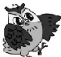
イメージキャラクター ズットちゃん