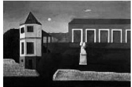
《エミール・ゾラの館》 小杉小二郎 キャンパス・油絵具