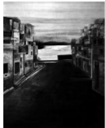
《雨あがり》 奥村美佳 麻紙・岩絵具・墨箔