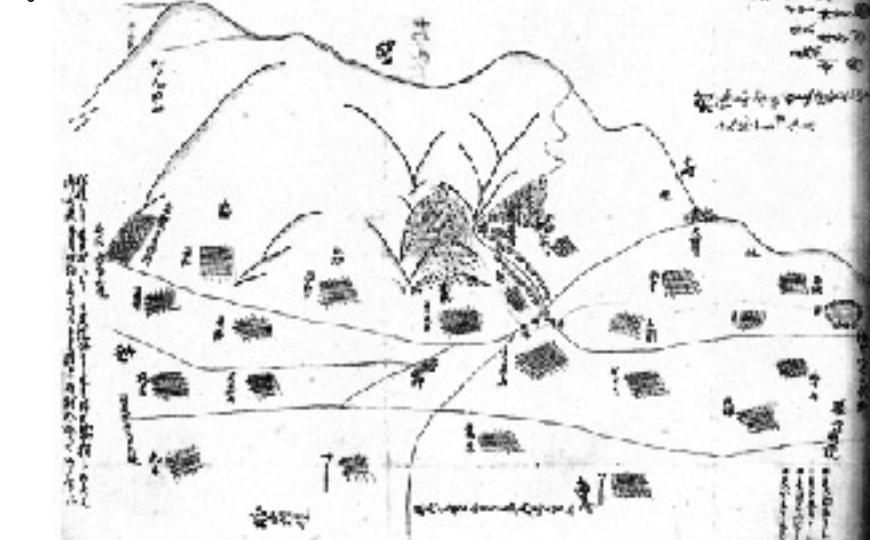
文化3年(1806)8月 大嵐村絵図 都留市蔵(森嶋家文書)『都留市史』より

座は後に御堂寺奥の院となり真言密教伝授行法の地と伝えられ、その礎石が現在も残っています。山腹には榛名池という玉水の湧出する場所もあります。また山麓の蓮華寺は、大同四年弘法大師空海が富士山小屋社に安置されていた諸像を大原村に移し、一宇を建立して大同山御堂寺という真言宗寺院を開いたのが始まりで、その後は弘安五年(一一八二)九月十二日に身延山より武州池上へ向かう日蓮聖人が川口村の上ノ坊に宿した際に、河口浅間神社の御師の梅屋采女を折伏(しゃくぶく)しました。采女は時に御堂寺の僧侶が私の兄弟なりと翌日聖人を大原村に伴いました。日蓮聖人は御堂寺の法玄阿闍梨と問答を行い、法玄阿闍梨を折伏しました。この時大きな石の上で問答を行つたといわれており、その問答大石は今も蓮華寺の鐘楼堂の下にあります。