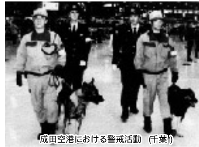
成田空港における警戒活動(千葉)