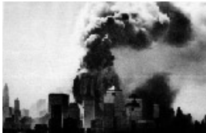
炎上する世界貿易センタービル(2001年9月)

こうした情勢のなかで、平成20年7月には北海道・洞爺湖サミットが開催されますが、平成17年の英国サミット開催時には、ロンドンの地下鉄が爆破され、多数の市民が犠牲になっています。警察では、このようなテロの脅威から皆様の安全・安心な生活を守るため、様々な対策を推進しています。