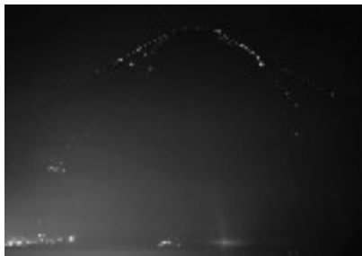
金賞 夏の夜の富士

今回で9回目になる「富士山写真大賞」には、北は北海道、南は熊本県までの全国の32都道府県から1403点(応募人数427人)の作品が寄せられました。今回の企画展では、この作品の中から厳正な審査によって選出された入選作100点と、番外編の30点の作品を展示しています。撮影者のそれぞれの視点から浮かび上がった、様々な富士の姿をご覧ください。