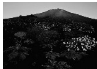
銅賞 あざみ咲く頃