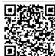
町公式ホームページ QRコード

QRコードを読み取ることができる携帯端末の場合は、QRコードをバーコードリーダーなどで読み込むことで町公式ホームページを見ることができます。