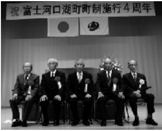
富士河口湖町 功労者

去る11月15日の町制記念日に、勝山ふれあいセンターにおいて、町制施行4周年の記念式典が行われました。この中で、これまでの行政進展に大きく貢献された功労者と善行のあった方、各種各種事業に協力いただいた方々への表彰と感謝状の贈呈が行われました。