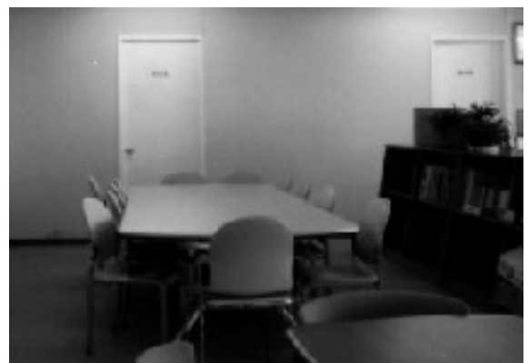
中央公民館の事務室をリニューアルした女性交流センター(みずうみ)