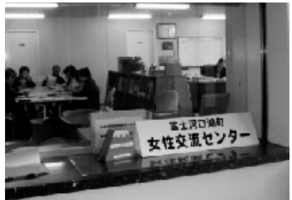
開所に向けて話し合う運営委員

富士河口湖町教育委員会 生涯学習課 男女共生・国際係 【TEL72- 6053】