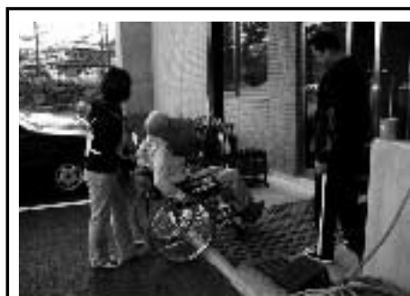
段差を降りるときは後ろ向きで