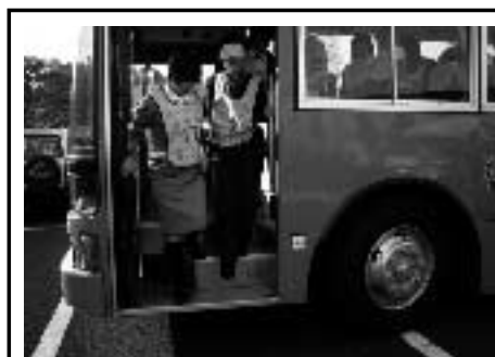
介助者の誘導によりバスを降りる

参加者や講師からの感想は、「高齢者や障害者の人の気持ちが理解できた。」「高齢者体験では、視野がせまくぼやけて見えないので歩くことが大変だった。」「皆さんからの暖かい声かけをまっている。」などでした。今後は心のバリアフリー化にあたって、ハード面だけでなく、人的な対応や利用者に対する情報提供など、ソフト施策を充実し、ハード・ソフトが一体となって「心のバリアフリー社会」の実現を目指していきたいと思います。