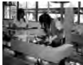
高齢者を装着した手袋や重りや疑似体験(茶碗洗いに挑戦)

富士河口湖高校の生徒を対象に、2日にわたり実施。生徒20名が参加。8月4日は、6名が参加。県立介護実習普及センターで、高齢者の疑似体験や福祉用具作りを行いました。