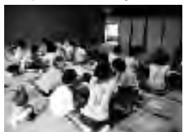
河高生、ボランティア手拍子で「ふるさと」を歌いました

2日目の8月9日(水)は、同校の茶道部も含め14名が参加。「生き生き交流広場」のお年寄りと、町ボランティアアロビー個人登録者と一緒に、「ふるさと」など懐かしい唱歌を歌ったり、ゲームなどで楽しみました。また、茶道部から、抹茶をいただき、皆おいしそうに飲みほしていました。同校は、7年前から高齢者との交流活動を実施をしています。