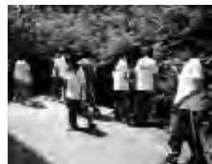
富士山麓の動物や植物を観察、環境について学習

8月3日、山梨県環境科学研究所で実施。中学生16名が参加。同所職員に実際に外に出て動物や植物の観察しました。また、水質汚染の現状や、外国の水をきれいにする取り組みなど環境について学習しました。