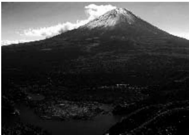
富士の樹海と精進湖