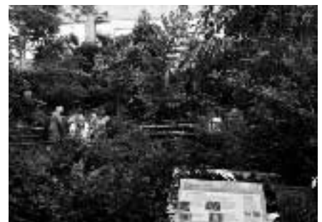
（マクガイアセンター）

今年の大会は、参加総数が約300名もあり、これまでで最も多い30カ国からの参加があったこと、アメリカのほぼ全ての州から参加があったということでも大きな大会でした。ここで得たことを、これからの富士山北麓での自然と共生（共存）するための調査や研究、自然保護に役立てて行きたいと思います。皆様のご支援とご協力に深謝いたします。