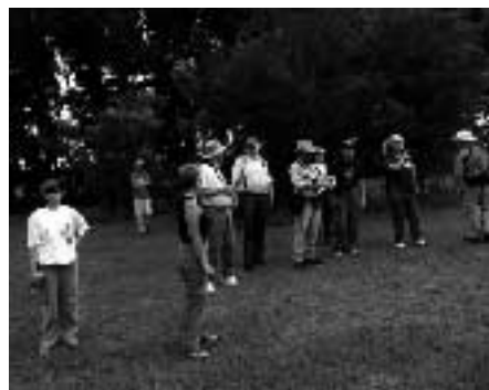
（フィールドトリップ）

誇る自然史博物館で、シジミチョウ科を中心に世界中の標本を見ることができました（来年には600万頭を超える予定とのことでした）。