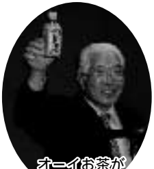
「おーいお茶がはいったぞー！」

まだまだ「男女共同参画社会」ということが、なんだかむずかしく、地域になじんでいないのが現状です。もっとわかりやすく伝えていくためにパフォーマンスをみていた