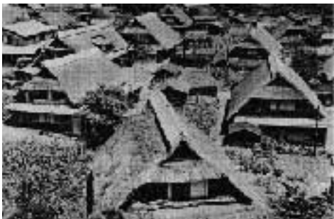
災害前の根場部落

9月25日午前2時頃台風は通過し、やれやれと思つた時に西湖地区から、人家流失、救援頼むの電話連絡を最後にすべて通信は麻痺状態となり交通は寸断された。半信半疑の時に徒歩連絡にて被害の甚大さを知る。直ちに役場職員全員召集し、状況把握に全力を傾注したのであるが夜間のため困難を極めた。朝の4時頃根場部落全滅の報が富士吉