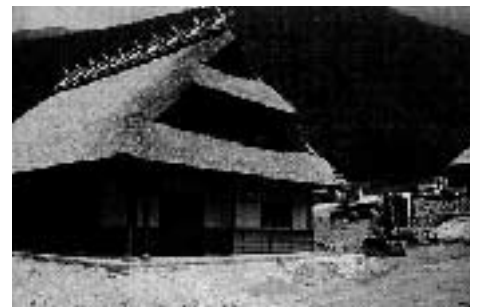
「西湖いやしの里 根場」整備状況

今年から町の取り組みとして根場地区に「西湖いやしの里根場」創出事業を展開しています。この事業は災害前の根場地区の文化と原風景を再現するもので、地区に住むものとして400年の歴史をもつ平和郷であった根場地区に、今さらながら思いを馳せ感動を覚えます。と同時にこの「西湖いやしの里根場」は近隣の蝙蝠穴、野鳥の森公園と合わせて大きな観光エリアになるものと期待されます。