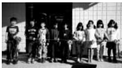
こども達による、開所式