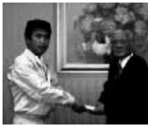
土手影建設（株）さん