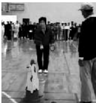
「ガンパレー」の熱い声援の中、「それ、入れ!」

当日は、民生・児童委員の皆さんに、競技進行等のご協力をいただきました。紙面をお借りして、御礼申し上げます。