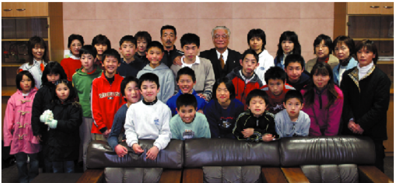
北麓ファイターズの皆さん