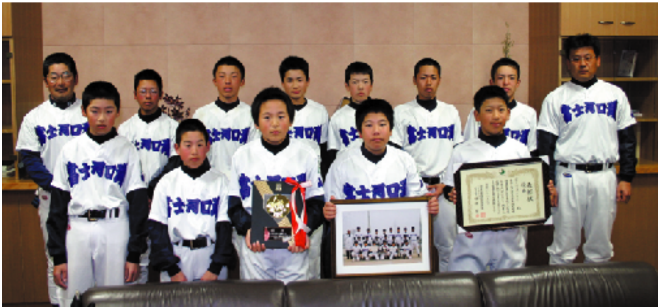
富士河口湖ベースボールクラブの皆さん