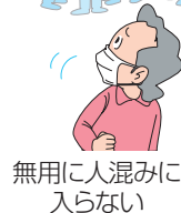
無用 に人混み に入らない