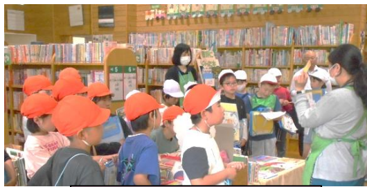
生涯学習館の見学