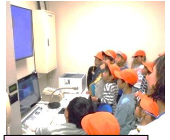
防災放送室の見学

生涯学習館では、本の種類の紹介や貸し出し方法について説明をしてもらいました。また、子ども未来創造館では、施設の役割と施設での過ごし方について説明してもらいました。町の人々が快適に過ごせられるように、工夫をしたり環境を整えたりして仕事をしてくださっている方々いることを子どもたちは学ぶことができました。