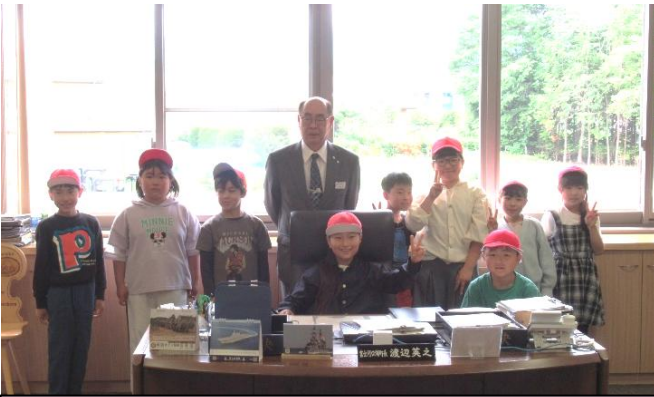
町長さんと記念撮影（西浜小・大嵐小・富士豊茂小）