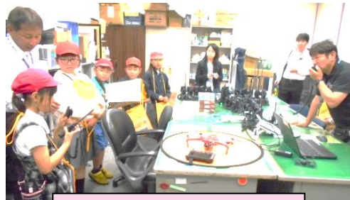
防災指令室の見学