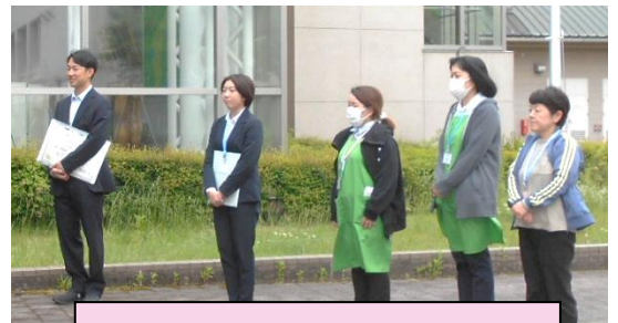
説明して下さったみなさん

実際に足を運び目で見たことで、各場所でどのような方々が町の人々のために仕事をしているのかを学ぶことができたと思います。この見学が今後の学習へと生かされることを期待しています。