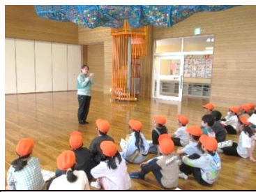
子ども未来創造館の見学