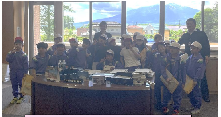
副町長さんと記念撮影（勝山小）

毎年、町内全ての小学校3年生が社会科の学習で、町役場・生涯学習館・子ども未来創造館の見学を行っています。5月13日(水)より見学が順次スタートし、6月に町内全ての小学校が見学を終えました。