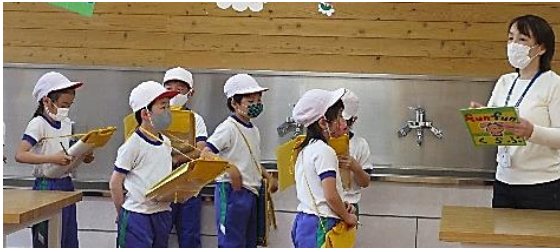
子ども未来創造館