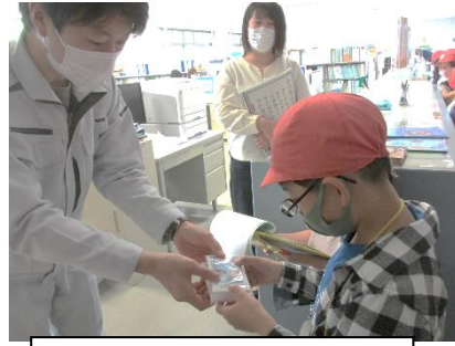
水道課よりティッシュのプレゼント