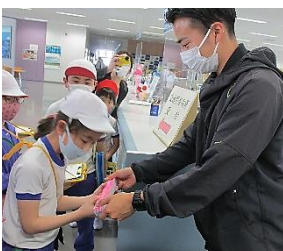
地域防災課より防犯用品のプレゼント

説明を聞きながらしっかりメモを取って学びを深めている子どもたちの姿が大変立派でした。