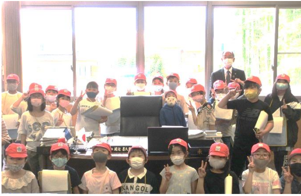
副町長さんと記念撮影