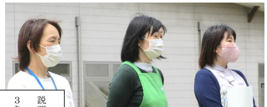
3名の皆さん 説明して下さった