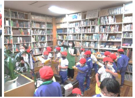
生涯学習館（図書館）