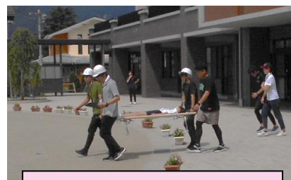
救助訓練の様子(船津小)

いた子どもたちは訓練の放送を聞くとすぐに校庭の中央に集まり、先生方と共に身の安全を確保していました。 今回の訓練では、さらに子ども1名が不明になっている設定でした。子どもたちや先生方が校庭へ避難した後、行方不明者がいることが発覚。先生方が校舎内に捜索へ行き、ケガ人役の子ども1名を発見。担架に乗せて、安全な場所へ救出するという訓練がされました。校庭へ避難していた子どもたちも、仲間が救助される様子を見守っていました。