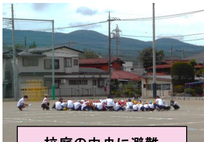
校庭の中央に避難

いざという時に備えて、2学期にも各学校で避難訓練が実施されます。前頁で紹介させていただいた防災講座の日にも、船津小学校では大地震を想定した避難訓練が行われました。今回は、中休みに子どもたちへの予告なしでの実施でした。休み時間には、子どもたちはそれぞれの場所で過ごしています。もしその時に大地震が起こった場合、どのように身の安全を確保し避難をすればよいかを子どもたち一人一人が考えなければなりません。校庭に