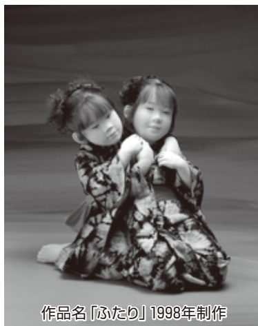
作品名「ふたり」1998年制作

■開館時間=9:30-17:00 (入館は16:30まで) TEL 0555-73-2829 ■入館料=一般・大学生800(720) 高校生・中学生500(450) カッコ内は8名以上の団体料金 ●主催=河口湖美術館 ●協力=パナソニック電気 ●企画協力=プレートラスト