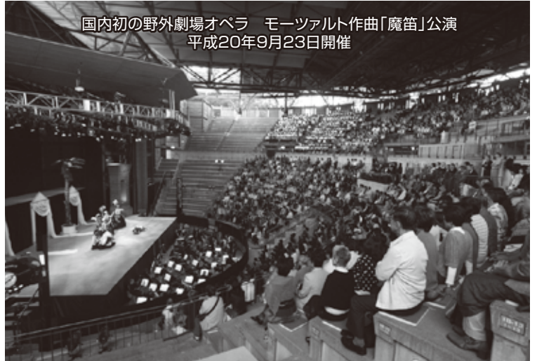
国内初の野外劇場オペラ モーツァルト作曲「魔笛」公演 平成20年9月23日開催

平成二十年夏、住民主体の町誕生祭実行委員会の中から「新町になつてからの新しいシンボルソングがあつたら」そんなアイデアが出てきたことがきっかけで、平成七年（一九九五）のオープンニングコンサートに出演し、また、その後国際自然保